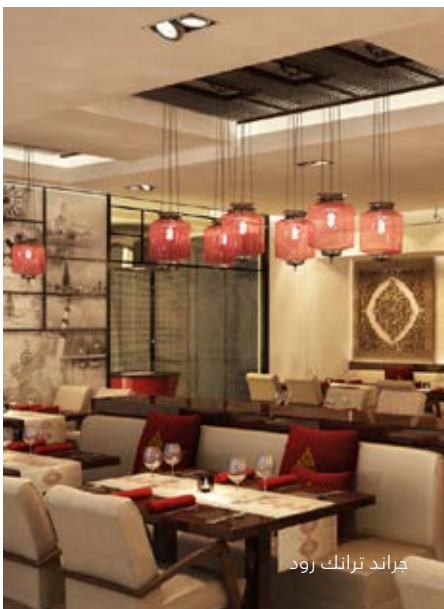
جرائد ترانك رود